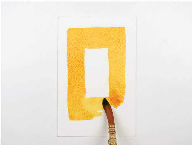
Contourner la zone

Contrairement à l'huile ou l'acrylique, l'aquarelle ne permet pas de couvrir une couleur avec du blanc. Les zones claires et les lumières doivent donc être anticipées et préservées dès le début. Il est certes possible de retirer un peu de pigment en remouillant une zone peinte — ou en tamponnant avec un mouchoir tant que la couleur est encore fraîche — mais le résultat reste limité. Prendre l'habitude de planifier ses lumières avant de commencer est, de ce fait, absolument essentiel.