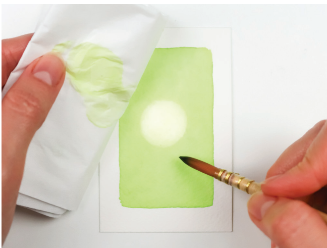
Faire du retrait