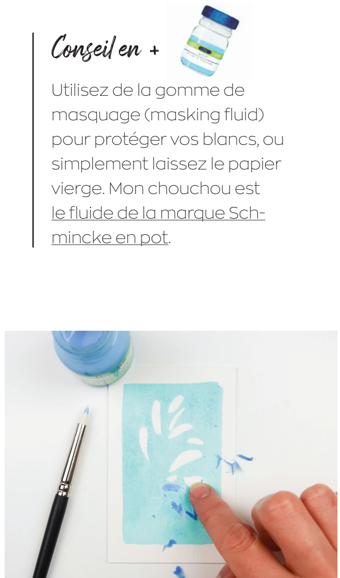
Gomme de masquage